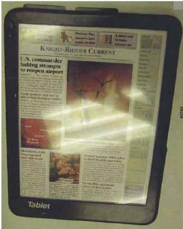
(1994 Fidler Tablet)