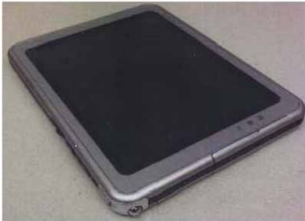
(Hewlett-Packard Compaq Tablet TC1000)