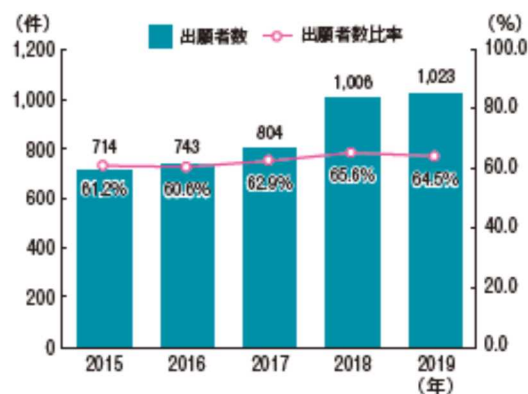
中小企業による国際登録商標出願件数の推移